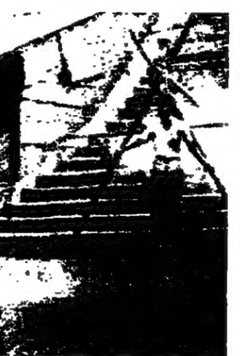
جرت في اسبوعين عمليات اعدام استهدفت بعض المواطنين للحكم